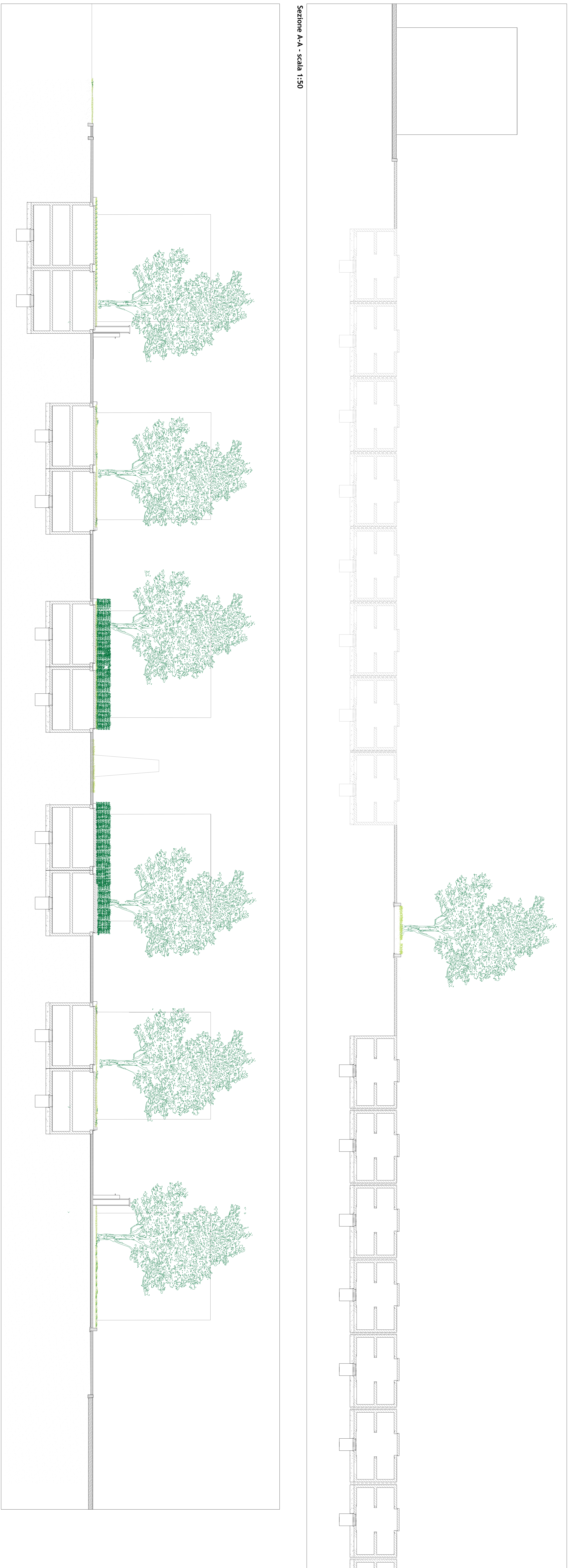
Sezione A-A - scala 1:50