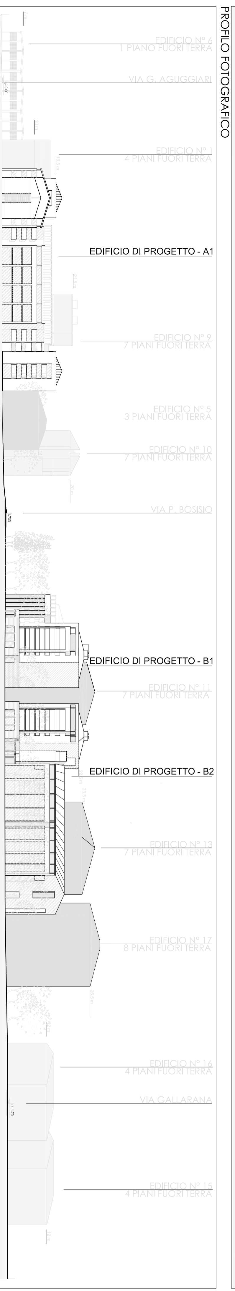
PROFILLO STATO FUTURO - SEZIONE A - A'