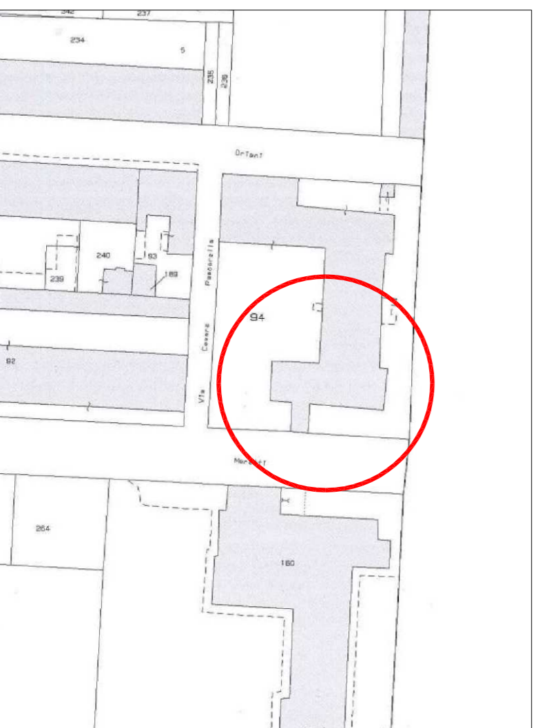
ESTRATTO MAPPA - FOGLIO n. 62