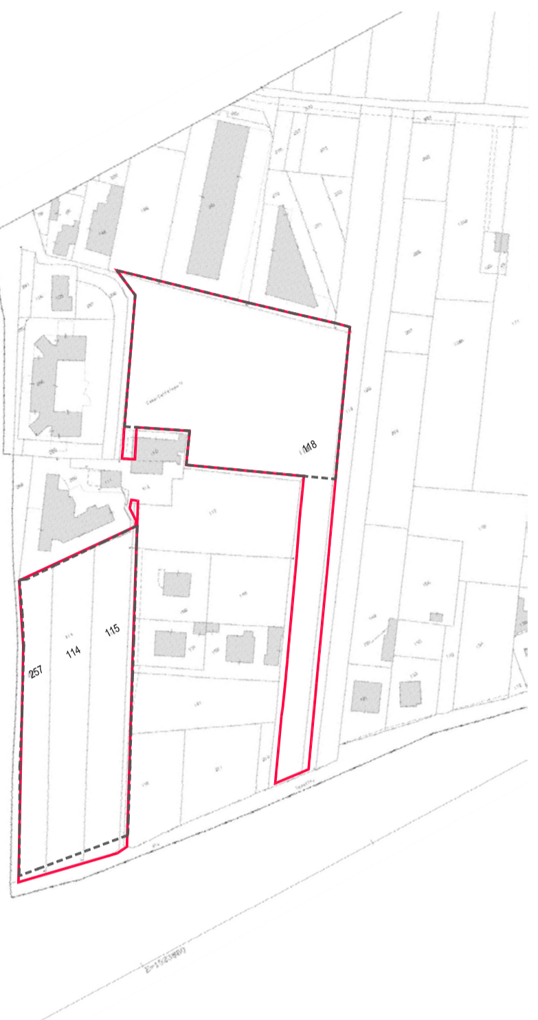
ESTRATTO DI MAPPA - individuazione aree interessate dall'intervento comprese nelle aree sistema