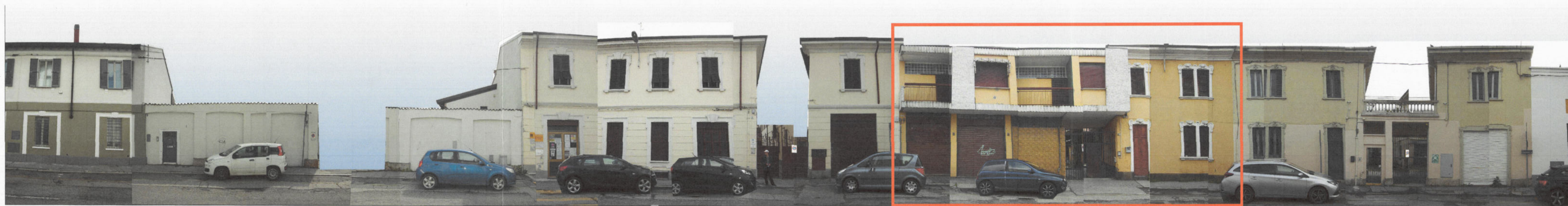
PROSPETTO SU VIA PIAVE STATO DI FATTO