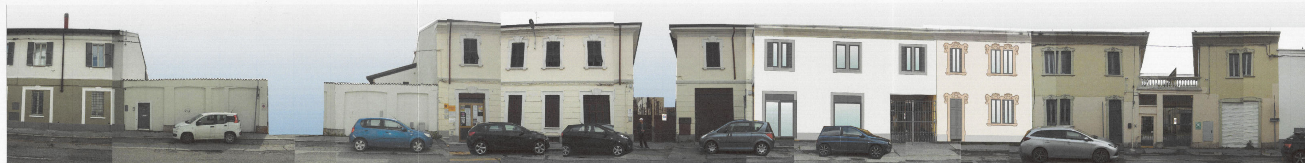
PROSPETTO SU VIA PIAVE STATO DI PROGETTO