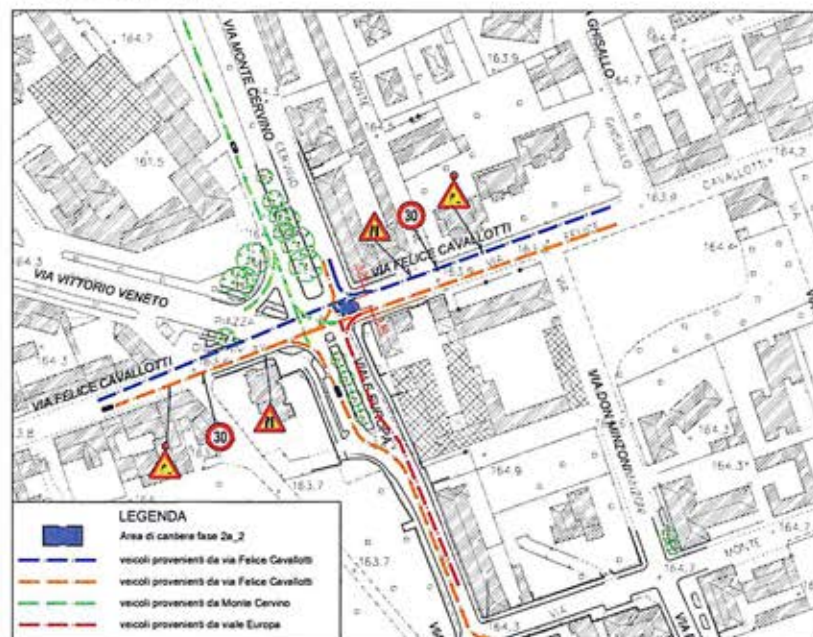
VIABILITA' - FASE 2a_2