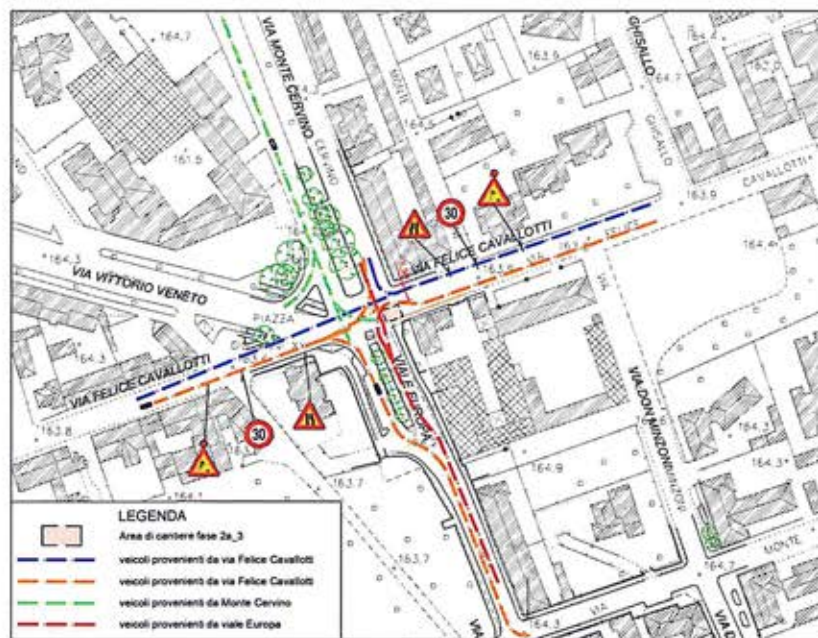
VIABILITA' - FASE 2a_3